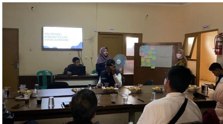
Gambar 5. Tim melakukan Asesmen Awal

Tahap ketiga adalah asesmen, proses asesmen ini dilakukan selama 7 hari, dimana terdapat proses asesmen awal dan proses asesmen lanjutan. Asesmen awal dilakukan dengan mengidentifikasi permasalahan serta kebutuhan dan kelompok sasaran yang potensial menjadi penerima manfaat untuk perubahan. Proses asesmen awal ini dilakukan dengan cara rembug bersama warga. Rembug ini digunakan untuk mengetahui program, hambatan, dan harapan baik di ranah masyarakat, organisasi, maupun kebijakan. Peserta rembug warga yaitu sejumlah 20 orang tamu undangan seperti Kepala Desa, Perangkat Desa, Ketua RW, Ketua Perwakilan Organisasi Desa, serta Tokoh Masyarakat. Proses pelaksanaan rembug warga ini menggunakan Methodology Participatory of Assesmen (MPA) (Kumala & Lessy, 2023). Peserta rembug diminta untuk mengisi metacard dan kertas plano yang didalamnya terdapat table asesmen dan rinciannya yang berisi Program Kegiatan. Tim PKM meminta peserta rembug mengisi program/kegiatan yang belum dilaksanakan, sudah dilaksanakan, maupun yang sudah berhenti. Selanjutnya peserta diminta mengisi hambatan apa yang dihadapi saat pelaksanaan. Terakhir peserta diminta untuk memilih permasalahan yang utama untuk segera ditangani, dengan melakukan voting suara terbanyak menjadi prioritas utama.