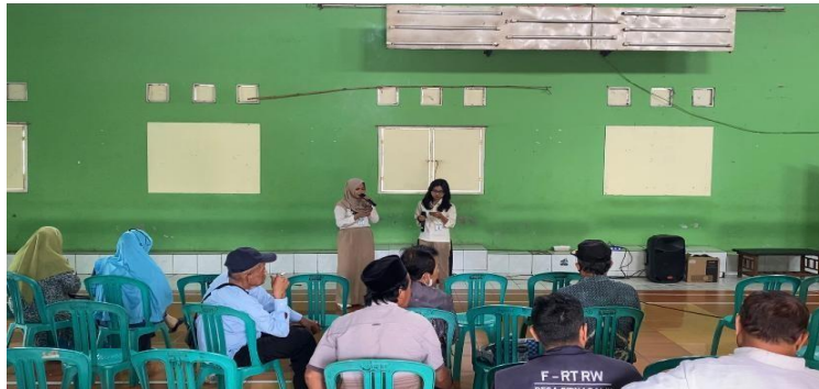
Gambar 4. Proses Pengorganisasian Sosial

Tahap ketiga adalah asesmen, proses asesmen ini dilakukan selama 7 hari, dimana terdapat proses asesmen awal dan proses asesmen lanjutan. Asesmen awal dilakukan dengan mengidentifikasi permasalahan serta kebutuhan dan kelompok sasaran yang potensial menjadi penerima manfaat untuk perubahan. Proses asesmen awal ini dilakukan dengan cara rembug bersama warga. Rembug ini digunakan untuk mengetahui program, hambatan, dan harapan baik di ranah masyarakat, organisasi, maupun kebijakan. Peserta rembug warga yaitu sejumlah 20 orang tamu undangan seperti Kepala Desa, Perangkat Desa, Ketua RW, Ketua Perwakilan Organisasi Desa, serta Tokoh Masyarakat. Proses pelaksanaan rembug warga ini menggunakan Methodology Participatory of Assesmen (MPA) (Kumala & Lessy, 2023). Peserta rembug diminta untuk mengisi metacard dan kertas plano yang didalamnya terdapat table asesmen dan rinciannya yang berisi Program Kegiatan. Tim PKM meminta peserta rembug mengisi program/kegiatan yang belum dilaksanakan, sudah dilaksanakan, maupun yang sudah berhenti. Selanjutnya peserta diminta mengisi hambatan apa yang dihadapi saat pelaksanaan. Terakhir peserta diminta untuk memilih permasalahan yang utama untuk segera ditangani, dengan melakukan voting suara terbanyak menjadi prioritas utama.