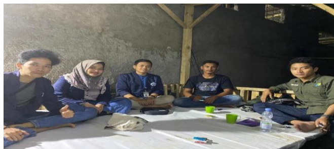
Gambar 3. Kunjungan Ke Rumah

Proses inisiasi ketiga yaitu melakukan kunjungan kerumah, hal ini dilakukan untuk menyampaikan perkenalan diri, menggali informasi secara langsung kepada masyarakat, tokoh – tokoh masyarakat, dan pemuda desa. Hal ini dilakukan untuk membangun kepercayaan dan kerjasama selama kegiatan PKM berlangsung.