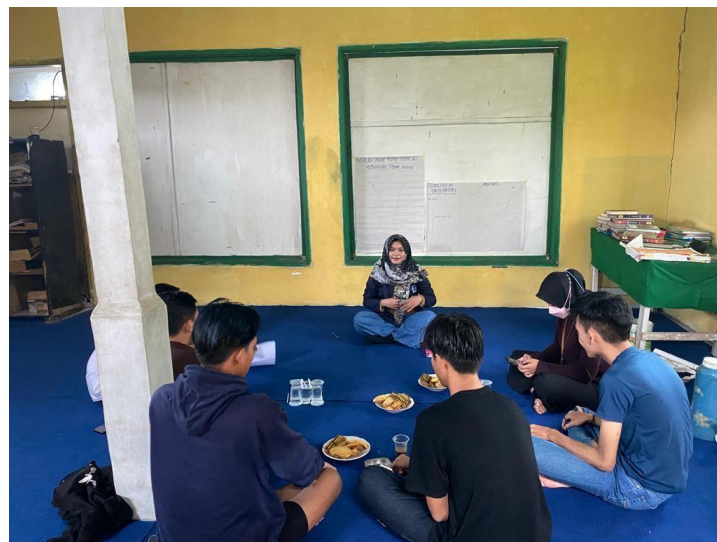
Gambar 6. Tim PKM melakukan Asesmen Lanjutan

Dari hasil voting tersebut tim PKM melanjutkan prosedur asesmen lanjutan, dalam hal ini fokus tim PKM mengarah pada Tim Kerja Masyarakat (TKM) yang telah dibentuk sebelumnya. Tim PKM mengundang dan memfasilitasi TKM untuk melakukan Focus Group Discussion (FGD). FGD dilakukan untuk mendiskusikan mengenai kondisi, penyebab, dan akibat permasalahan yang ada. Langkah selanjutnya yaitu mendiskusikan upaya apa yang sudah dilakukan untuk mengatasi masalah anak putus sekolah kemudian mendiskusikan kembali solusinya.