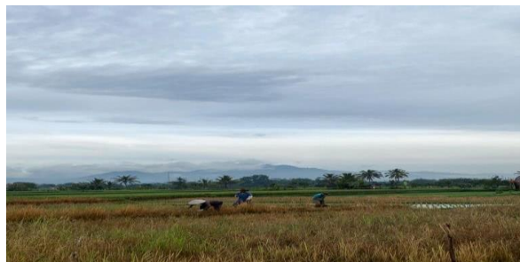
Gambar 2. Social Mapping Wilayah Desa

Proses inisiasi ketiga yaitu melakukan kunjungan kerumah, hal ini dilakukan untuk menyampaikan perkenalan diri, menggali informasi secara langsung kepada masyarakat, tokoh – tokoh masyarakat, dan pemuda desa. Hal ini dilakukan untuk membangun kepercayaan dan kerjasama selama kegiatan PKM berlangsung.