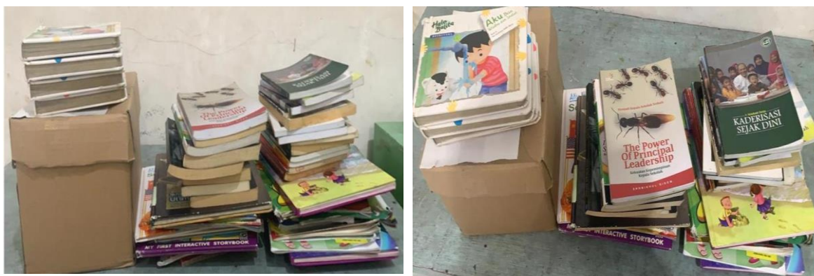
Gambar 5. Buku-buku Donasi