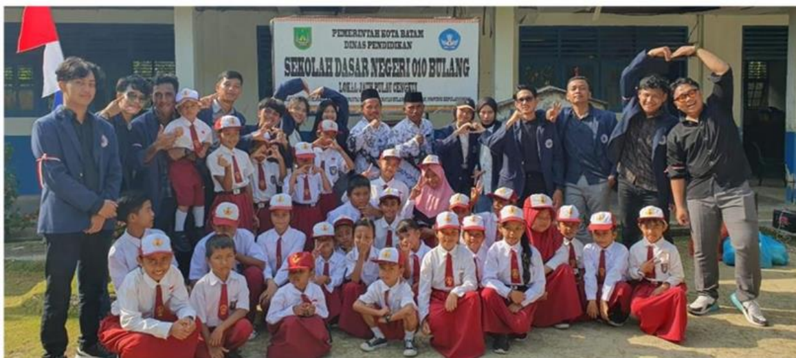
Gambar 4. Siswa SDN 10 Bulang

Memberikan Bantuan buku-buku SDN 10 Bulang berlangsung pada 24 September 2023. Dimana buku-buku ini berasal dari para donatur. Buku-buku yang diberikan sebanyak 50 judul buku dimana sebahagian besar buku-buku yang menarik siswa SD untuk membacanya, buku-buku tersebut color full dan memiliki gambar yang membantu visualisasi isi buku. Ketika buku-buku ini diberikan, siswa sangat antusias langsung membaca bukunya, dan setelah itu buku tersebut ditiptkan pada perpustakaan di SDN 10 Bulang.