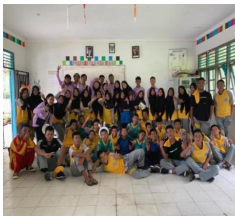
Gambar 2. Kegiatan Lomba Rangking 1 di SMPN 19 Batam