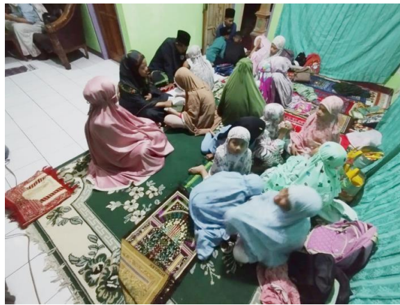
Gambar 2. Kegiatan Magrib Mengaji selama Pengabdian

Sebagai bentuk pengabdian masyarakat, program Magrib Mengaji di desa Panongan Lor. melibatkan secara aktif anak-anak usia sekolah, orang tua, serta tokoh masyarakat dalam kegiatan membaca Al-Qur'an dan penguatan karakter. Pengabdian ini merupakan sarana integrasi nilai-nilai religius ke dalam aktivitas sosial, sekaligus memperkuat hubungan antara akademisi dan masyarakat.